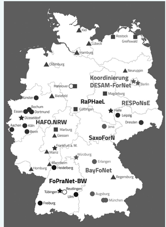
★ Konsortialführender Standort eines Netzes ● Weiterer allgemeinmedizinischer Standort im Netz ○ Nicht-allgemeinmedizinischer Standort im Netz ■ Assoziierter Partner der Initiative DESAM-ForNet ▲ Weiterer allgemeinmedizinischer Universitätsstandort

➔ Weitere Informationen zur Initiative DESAM-ForNet: www.desam-fornet.de/